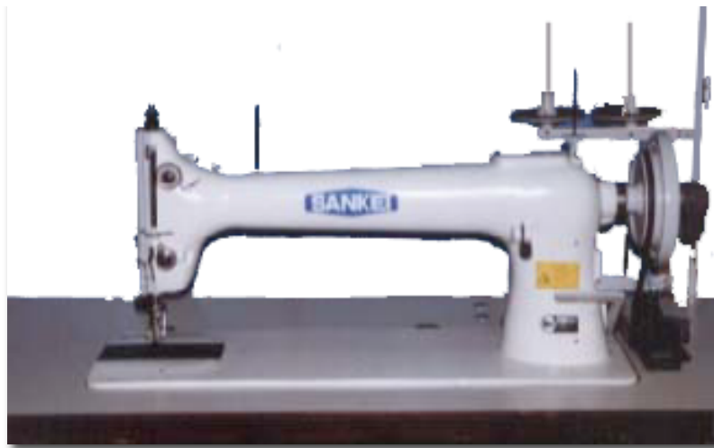
大型製品縫製に威力発揮のロングアームミシン